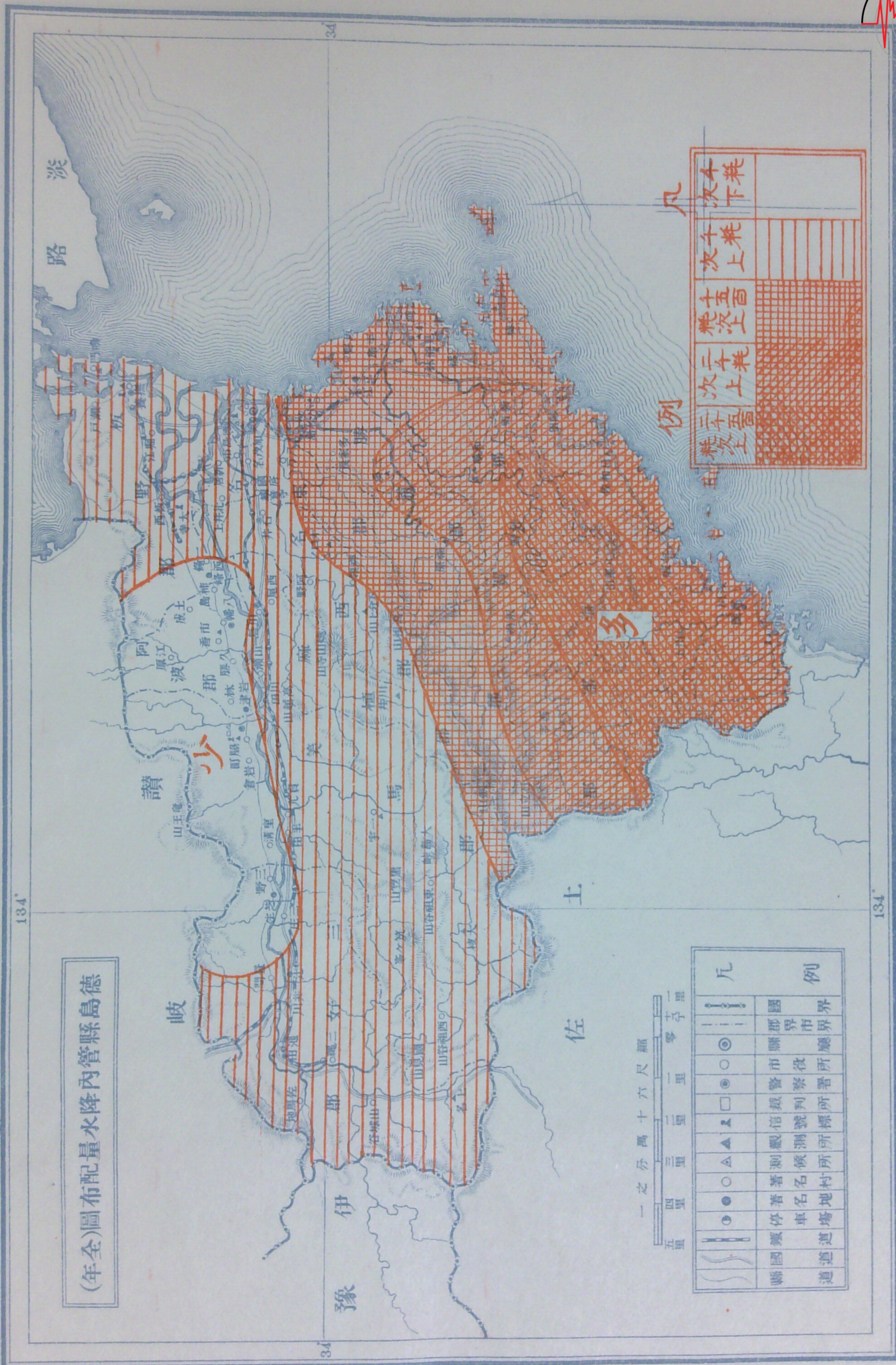
德島縣管内配置雨量圖(全年)